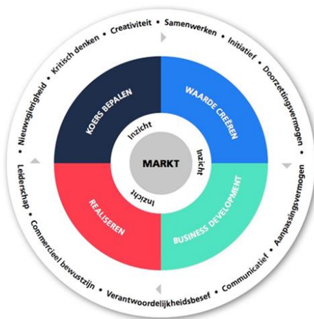
Fig. 3 "Schematische weergave van de kernbelofte van de CE'er" (LOO CE, 2017, p. 5)

"Inzicht is ook inzicht in jezelf en heeft in die zin een relatie met de commerciële skills die in de buitenste schil zijn opgenomen." (LOO CE 2017, p. 5).