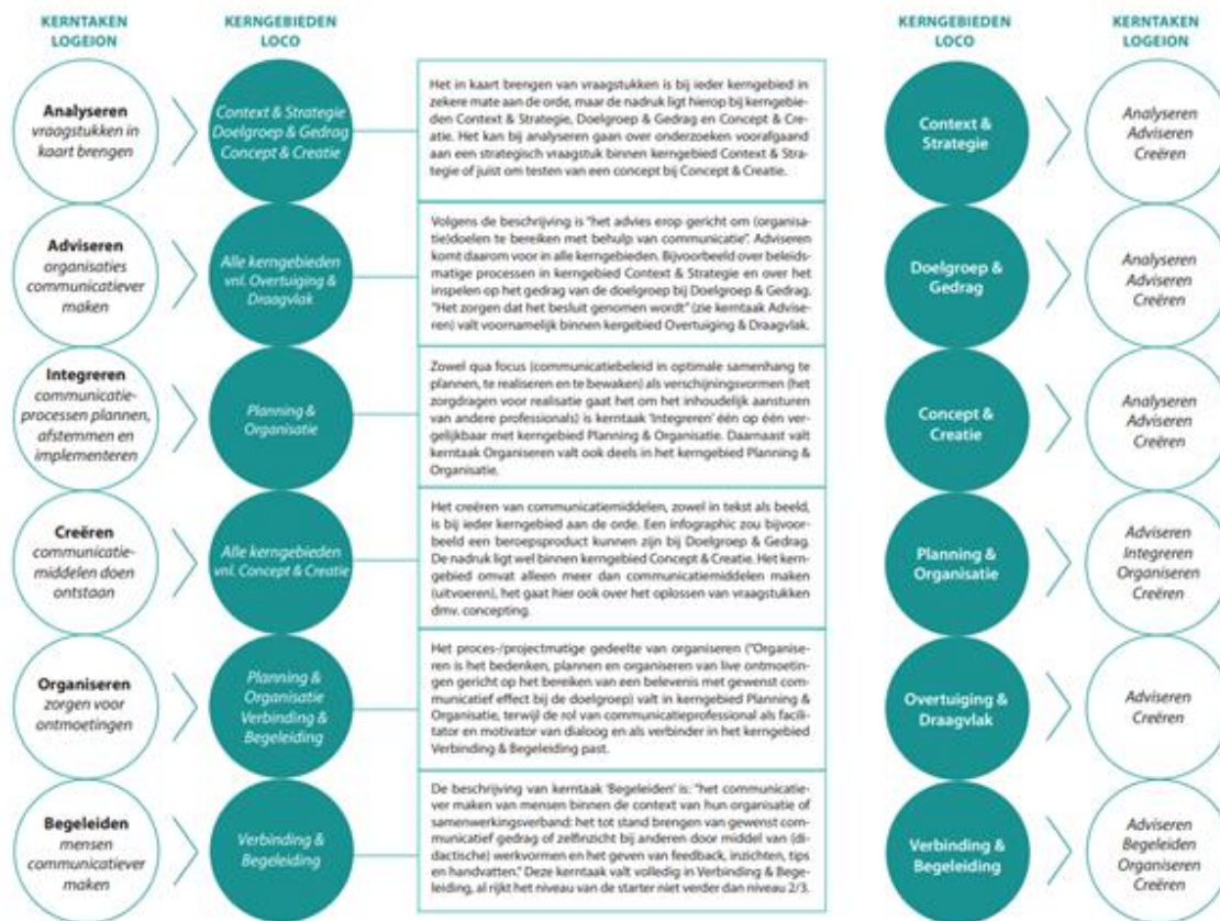
Figuur 1 Relatie kerntaken Logeion en kerngebieden LOCO 2019 6

Deze keuze is in lijn met de keuze om communicatieprofessionals op te leiden die strategisch kunnen denken in een omgeving waarin grenzen vervagen en waardoor zij dus als netwerkers tussen stakeholders moeten kunnen opereren.