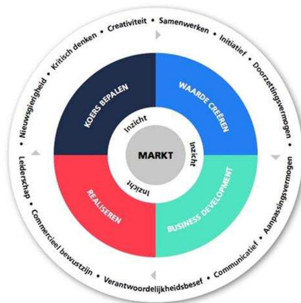
Fig. 3 "Schematische weergave van de kernbelofte van de CE'er" (LOO CE, 2017, p. 5)

"Inzicht is ook inzicht in jezelf en heeft in die zin een relatie met de commerciële skills die in de buitenste schil zijn opgenomen." (LOO CE 2017, p. 5).