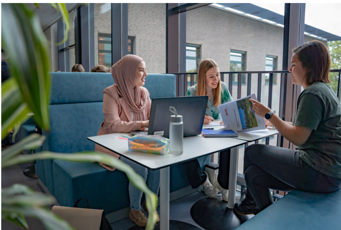
Tabel 2 Bezwaarschriften naar afhandeling

Als een student het niet eens is met een besluit dat door of namens het CvB is genomen, kan hij of zij hiertegen bezwaar aantekenen. Dat kan bijvoorbeeld gaan om besluiten over in- of uitschrijving, toelating tot een opleiding, restitutie of de hoogte van het collegegeld, een opgelegde sanctie. Avans Hogeschool heeft een Geschillenadviescommissie die aan het CvB advies uitbrengt over deze bezwaren. In 2021 zijn er in totaal 87 bezwaarschriften ingediend. In tabel 1 is te zien over welke onderwerpen door studenten een bezwaar is ingediend. Hoe de bezwaren zijn afgehandeld is opgenomen in tabel 2 onder aan de pagina.