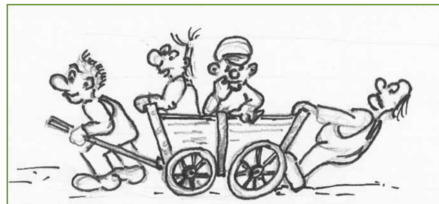
Figuur 1 Krachten bij veranderingen

Het afgelopen jaar zijn wij als lectoraat met de kenniskringleden en studenten het veld ingetrokken om te horen hoe, onder meer professionals over deze transformatie denken (Hooghiemstra & Verharen, 2013). Op het niveau van de uitgangspunten lijken zij zich hier wel in te kunnen vinden. Menigeeen is er zelfs ronduit enthousiast over en vervult een voortrekkersrol in het realiseren van de veranderingen. We spraken ook professionals die heel kritisch zijn, vragen stellen bij de haalbaarheid en wijzen op de risico's. Eigenlijk hoeven we ons daar niet over te verbazen. Meebewegen en tegenbewegen zijn nu eenmaal belangrijke krachten bij veranderingen. Ooit mocht ik deelnemen aan een intervisietraject over verandermanagement, waar een afbeelding werd gepresenteerd van een kar met trekkers, meerrijders en achter-de-kar-hangers, gebaseerd op de indeling van Rogers (1995).